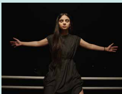
Abb. 5: Auf dem Geländer des Balkons