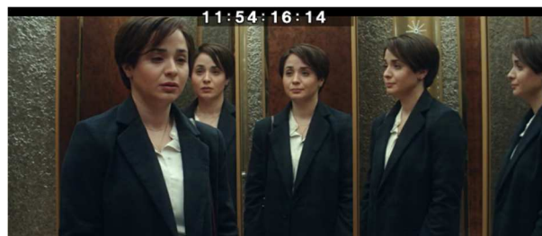
Letzte Einstellung des Films