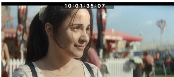
Erste Einstellung des Films

Dennoch gibt die Regisseurin bereits zwei kleine Hinweise auf den Ausgang der Geschichte(n): (1) Auf der Tonspur sind danach im Off lauter werdende, nicht genau zu identifizierende Geräusche und Stimmen zu hören, die teilweise wie Schreie klingen. Durch die nächsten Einstellungen wird zwar deutlich, dass es sich um die Geräuschkulisse der Kirmes handelt, auf der Asli nun zu sehen ist. Dennoch evozieren die Schreie auch die Katastrophe des 11. Septembers. (2) Auch auf das Ende der Liebesgeschichte findet sich ein Hinweis. Aus dem Off erklingt ein Ausschnitt aus Marianne Rosenbergs Schlagerhit „Er gehört zu mir“ : „Ist es wahre Liebe, die nie mehr vergeht? Oder wird die Liebe vom Winde verweht?“