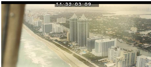
Asli und Saeed fliegen über Miami

Da der Film konsequent aus Aslis Sicht erzählt (siehe unten: Filmisches Erzählen), werden die Anschläge vom 11. September nur aus ihrer Perspektive gezeigt und behutsam visualisiert: Nach einem kurzen Eingriff sieht sie mit anderen im Krankenhaus Bilder aus New York. (Visuell wird auf die Anschläge auf die Twin Towers übrigens bei Aslis USA-Besuch vorverwiesen: Bei ihrem Rundflug fliegen Saeed und Asli auch an zwei kleineren Hochhäusern in Miami vorbei.)