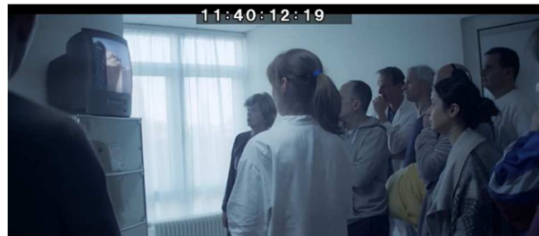
Asli erfährt von den Anschlägen im Fernsehen

Bei den Anschlägen am 11. September 2001 entführten 19 islamistische Attentäter mehrere Flugzeuge. Zwei Flugzeuge steuerten sie in die Zwillingtürme des World Trade Centers in New York, das dritte Flugzeug in das Pentagon, das US-Verteidigungsministerium bei Washington. Ziad Jarrah, der Pilot des vierten Flugzeugs (United-Airlines-Flug 93), das möglicherweise in das Weiße Haus in Washington stürzen sollte, bringt die Maschine auf einem freien Feld in Pennsylvania zum Absturz, nachdem Passagiere die Entführer angegriffen hatten. 2 Bereits kurz nach den Anschlägen wird das Terrornetzwerks Al-Qaida mit seinem Kopf Osama bin Laden als Hauptverdächtiger identifiziert. Bin Laden bekannte sich 2002 in einem Video offiziell zu den Anschlägen, bei denen rund 3.000 Menschen ums Leben kamen.